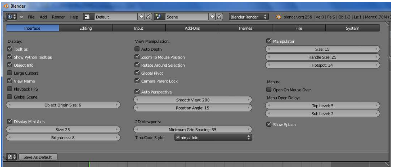
Rys. 1 Ustawienia „User Preferences”zakładka „Interface”.